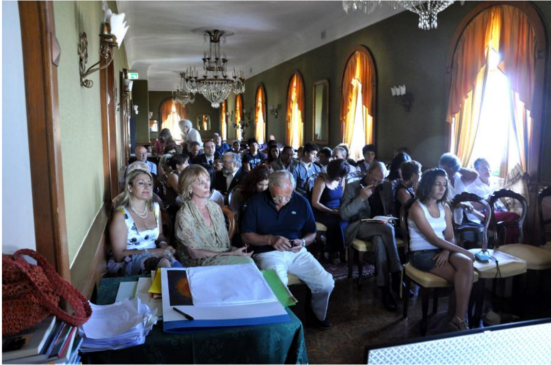
La sede del premio, presso il Castello Miramare di Formia